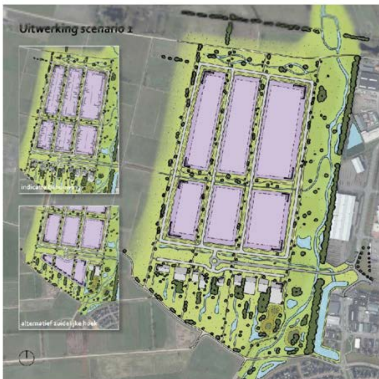
Figuur 2 - Te ontwikkelen bedrijventerrein.

Rijssen is een stad in de gemeente Rijssen-Holten en ligt in de provincie Overijssel, tussen Deventer en Almelo. De stad telde op 1 januari 2021 28.815 inwoners en is 2.806 hectare groot.