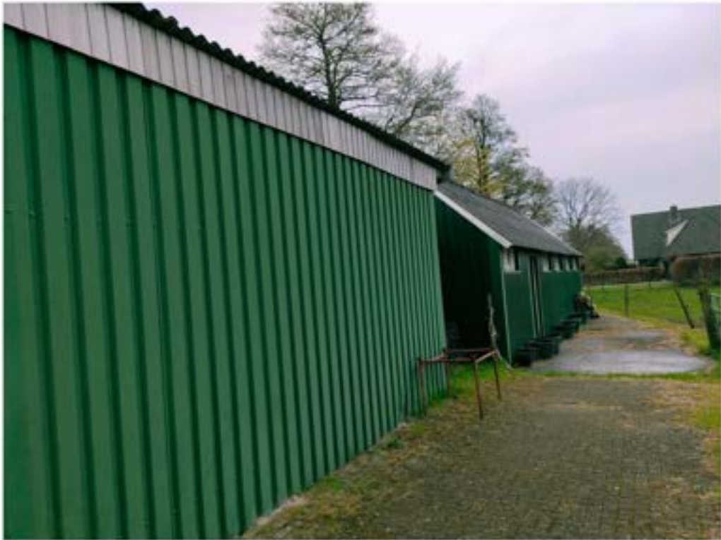
2. Maisweg, Schuur, opgetrokken uit bakstenen en damwandprofielen muren, gedekt met golfplaten.