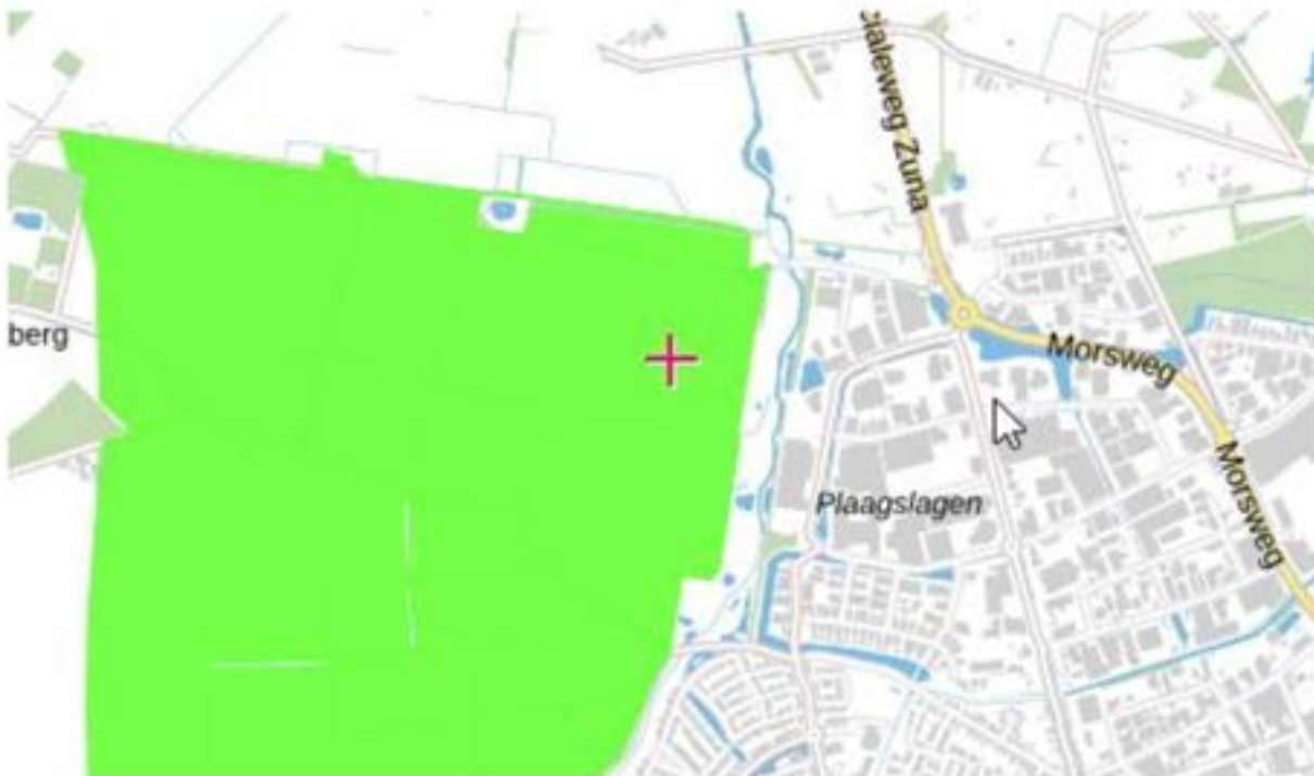
Figuur 6 – Weidevogelgebied Overijssel

Het plangebied valt binnen de begrenzing van de weidevogelgebieden welke zijn opgenomen in de omgevingsverordening van de provincie Overijssel. Hiervoor gelden geen andere regels dan de geldende bepalingen in de Wet natuurbescherming en de lijst jaarrond beschermde nesten alsmede een lijst ten aanzien van jaarrond beschermde leefgebieden van de Provincie Overijssel.