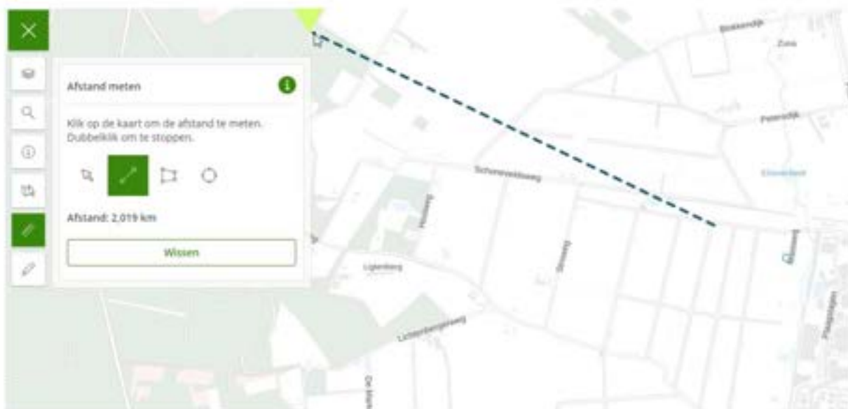
Figuur 3 – Natura 2000-gebied Sallandse Heuvelrug

U kunt te maken hebben met de zogenoemde externe werking van het Natura 2000-gebied. U moet daarbij bijvoorbeeld denken aan mogelijke effecten op de waterhuishouding, uitstoot van stikstof of effecten die het gevolg zijn van een groot project zoals aanleg van windmolens, zandwinning, een woonwijk of industrie. Om te bepalen of dit het geval is moet een natuurtoets worden uitgevoerd door een deskundig bureau. Als uw activiteit een negatief effect heeft op de instandhoudingsdoelstellingen van het Natura 2000-gebied is een vergunning nodig, voor meer info zie: vergunning Natura 2000-gebieden.