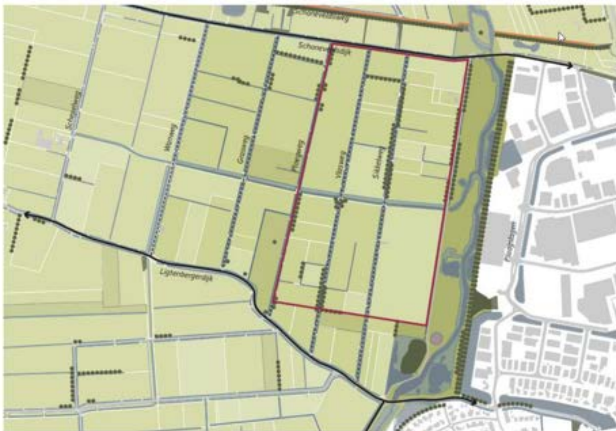
Figuur 1 – Planlocatie en onderzoeksgebied.

De planlocatie betreft een aantal percelen (zie figuur 1) gelegen tussen de Plaagslagen en de Ploegweg aan de rand van Rijssen. Op de planlocatie zijn een aantal opstallen aanwezig bestaande uit een woning en garage aan de [ ] en verspreid door het gebied nog enkele stallen/schuren. Het overige terrein is ingericht als openbare ruimte t.b.v. verkeer en weilanden. Tevens is tussen de Plaagslagen en de Maisweg een natuurgebied gelegen. Dit natuurgebied maakt onderdeel uit van het Natuur Netwerk Nederland. Het betreft het deelgebied Reggedal.