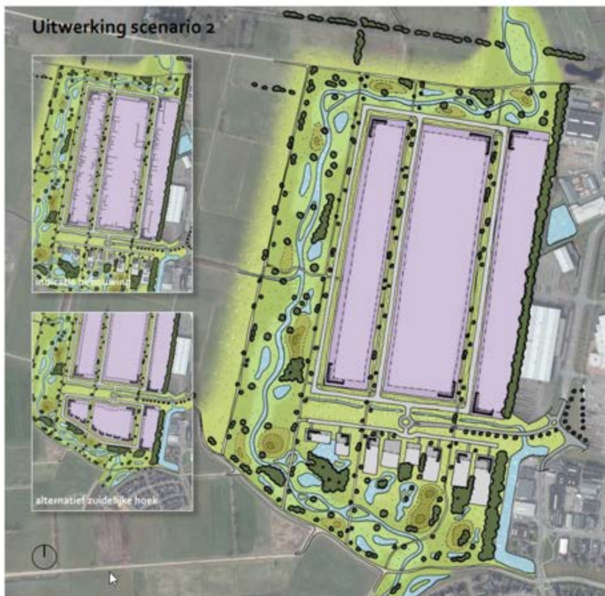
Figuur 2 - Te ontwikkelen bedrijventerrein

Rijssen is een stad in de gemeente Rijssen-Holten en ligt in de provincie Overijssel, tussen Deventer en Almelo. De stad telde op 1 januari 2021 28.815 inwoners en is 2.806 hectare groot.